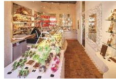
Al Porto Piazza Ascona Ascona, Piazza G. Motta Lu-Do 8.00-12.00/13.00-18.00 Mercoledì chiuso