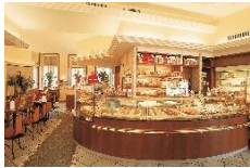
Al Porto Piazza Stazione Locarno, Piazza Stazione 6 7/7 giorni 06.30-18.30