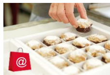
Boutique Online www.alporto.ch 7/7 giorni e 24/24 ore

Scoprite Il mondo pieno di prelibatezze Eine Welt voller Köstlichkeiten