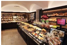
Al Porto Locarno Portici Locarno, Largo Zorzi 10 Lu-Sa 08.00-18.30 Do 08.00-17.00