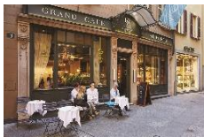
Rist. Grand Café Al Porto Lugano, Via Pessina 3 Lu-Sa 08.00-18.30 Do e festivi chiuso