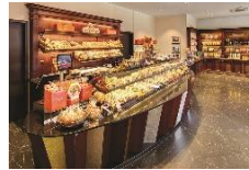
Al Porto Ascona Ascona, Viale Monte Verità Lu-Ve 7.30-18.30 Sa-Do 7.30-17.00