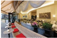
Al Porto Café Lago Locarno, Viale Verbano 7/7 giorni 08.00-18.30