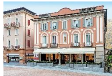
Al Porto Bellinzona Bellinzona, Piazza Stazione 7/7 giorni 07.00-18.30