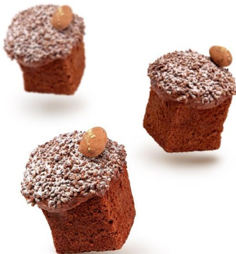
Cake al Cioccolato

Unsere handgefertigten Köstlichkeiten werden mit auserlesenen Zutaten und ohne Konservierungsmittel hergestellt, um stets die hohe Qualität der beliebten Al Porto Spezialitäten zu garantieren.