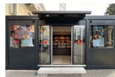
PopUp Al Porto Portici* Locarno, Largo Zorzi 10 Tel. 091 756 20 56