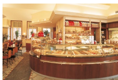
Al Porto Piazza Stazione* Locarno, Piazza Stazione 6 Tel. 091 743 65 16