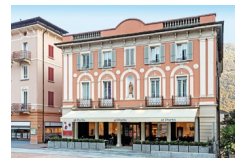
Al Porto Bellinzona* Bellinzona, Piazza Stazione Tel. 091 743 56 84

© Confiserie Al Porto SA. Con riserva di eventuali cambiamenti di prezzo e di assortimento. Fanno stato le condizioni di vendita pubblicate su alporto.ch.