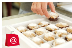
Boutique online* www.alporto.ch 24/24 h