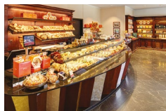
Al Porto Ascona* Ascona, Viale Mte Verità 11 Tel. 091 791 12 62