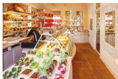
Al Porto Piazza Ascona* Ascona, Piazza G. Motta Tel. 091 791 20 36