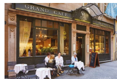
Grand Café Al Porto Lugano, Via Pessina 3 Tel. 091 910 51 30