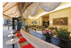
Al Porto Café Lago* Locarno, Viale Verbano Tel. 091 743 56 83