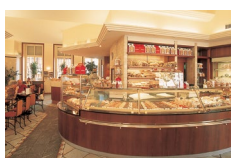
Al Porto Piazza Stazione* Locarno, Piazza Stazione 6 Tel. 091 743 65 16