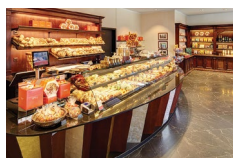
Al Porto Ascona* Ascona, Viale Mte Verità 11 Tel. 091 791 12 62