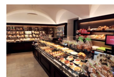
Al Porto Portici* Locarno, Largo Zorzi 10 Tel. 091 756 20 56