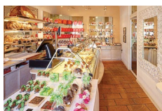
Al Porto Piazza Ascona* Ascona, Piazza G. Motta Tel. 091 791 20 36