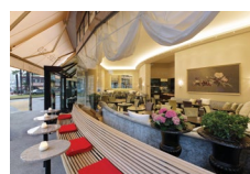
Al Porto Café Lago* Locarno, Viale Verbano Tel. 091 743 56 83