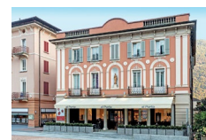
Al Porto Bellinzona* Bellinzona, Piazza Stazione Tel. 091 743 56 84

© Confiserie Al Porto SA. Con riserva di eventuali cambiamenti di prezzo e di assortimento. Fanno stato le condizioni di vendita pubblicate su alporto.ch .