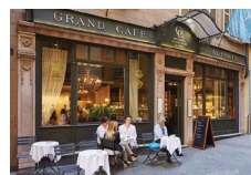
Grand Café Al Porto Lugano, Via Pessina 3 Tel. 091 910 51 30